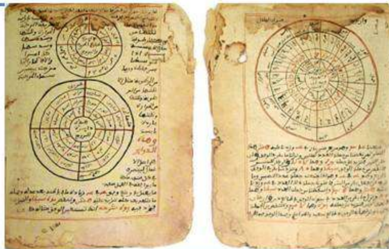
Порядок следования и расстояния до светил