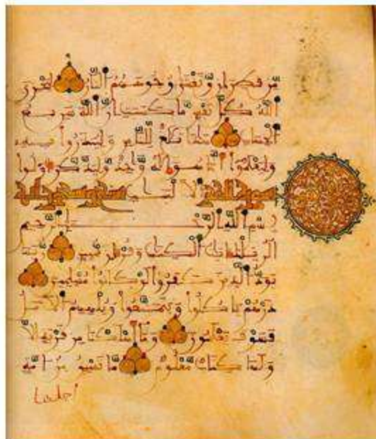
Страница из арабского манускрипта