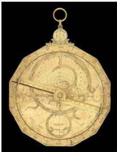
Астролябия восточной работы XIII в