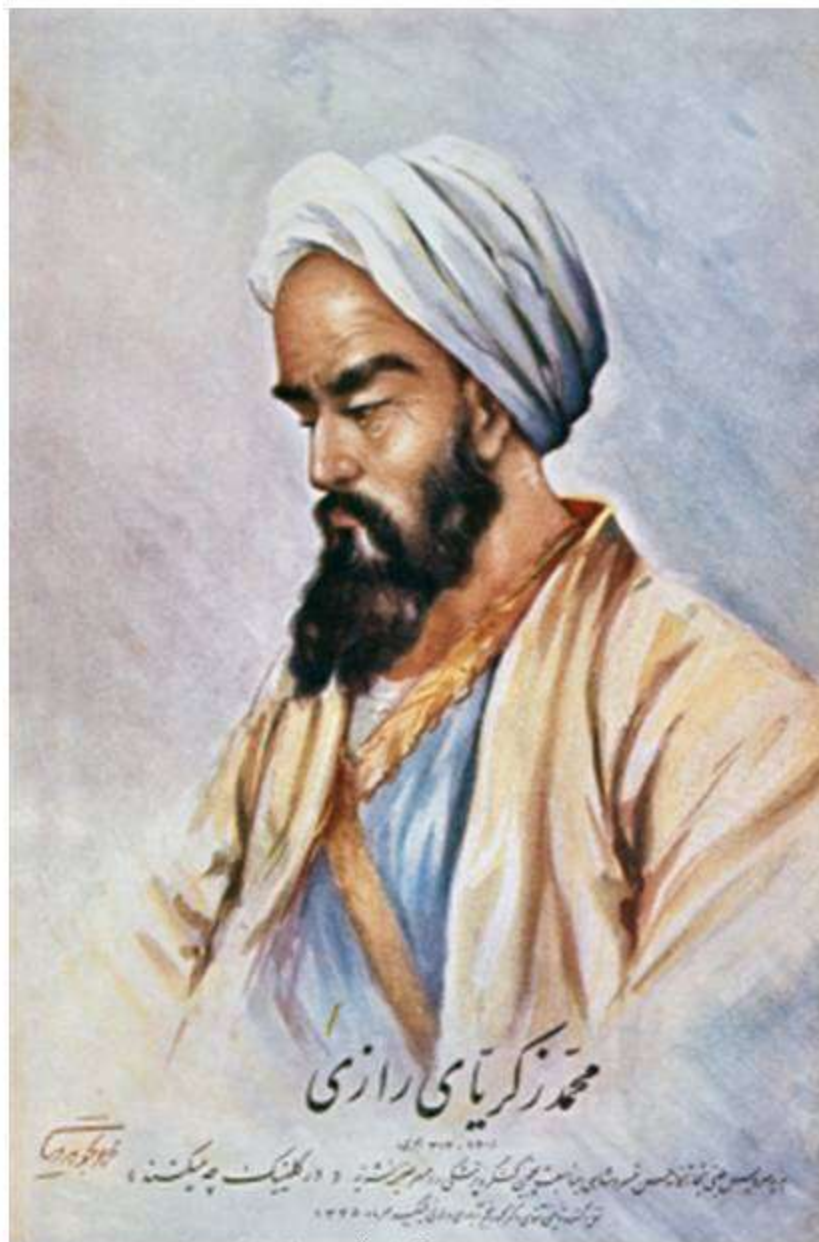
Учёный Абу ар-Рази

Мусульмане полагали, что занятия медициной не противоречат исламской вере. «Источником медицинской мудрости» называли выдающегося учёного Абу ар-Рази. По рассказам современников, он был превосходным учителем и сострада тельным врачом. Абу ар-Рази раздавал пищу беднякам, ухаживал и лечил их.