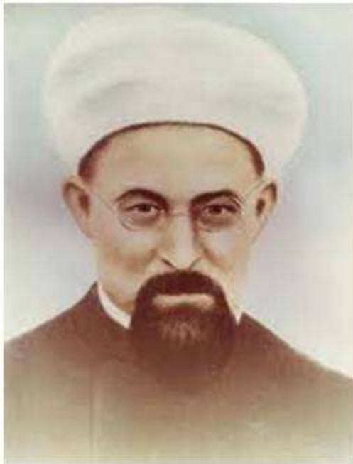
Галимжан Галеев Баруди

Высшие исламские школы называются медресе. Одно из самых известных — «Мухаммадия» — находится в Казани. Основателем её был муфтий Галимжан Галеев Баруди. На рубеже XIX-XX веков он был известен как видный просветитель, знаток религии, философ. В этом медресе приобретают знания представители многих мусульманских народов России.