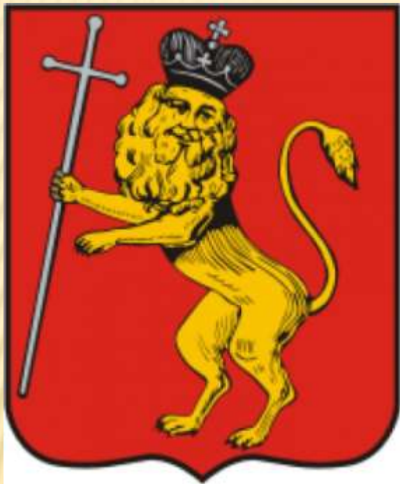
Герб г. Владимира

6. Рассмотрите гербы. Опишите, что на них изображено. Попробуйте объяснить их символическое значение. Запишите ответ.