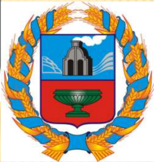
Герб Алтайского края