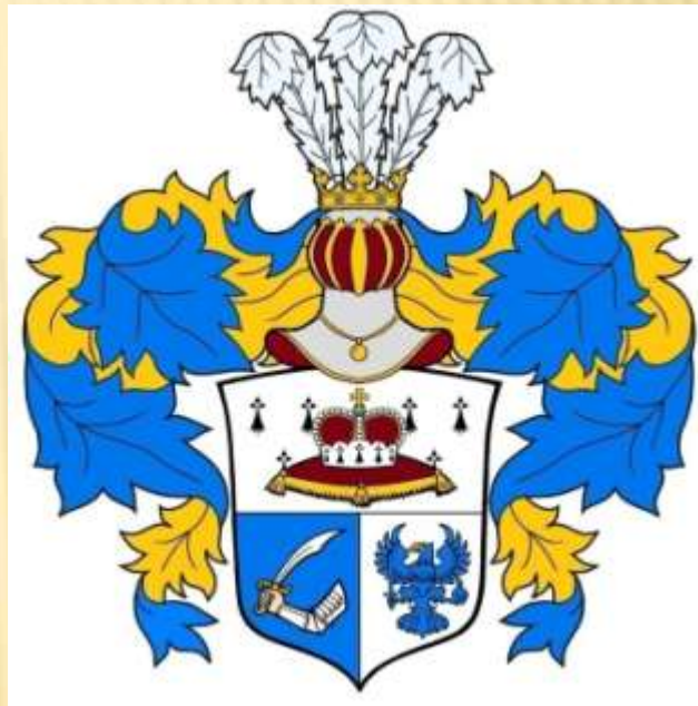
Герб рода Пушкиных