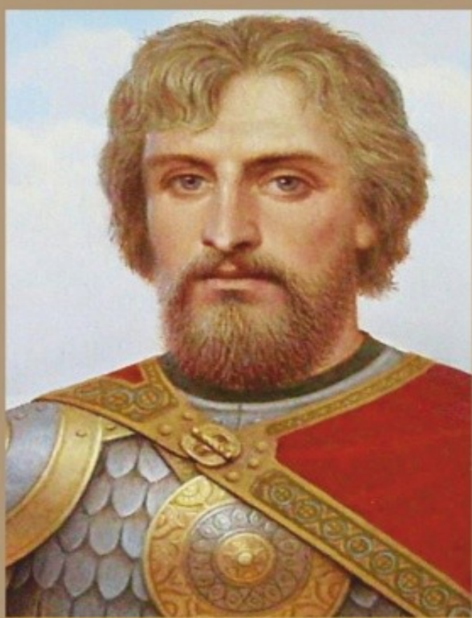
Невский Александр Ярославич (1221 - 1263 гг.)