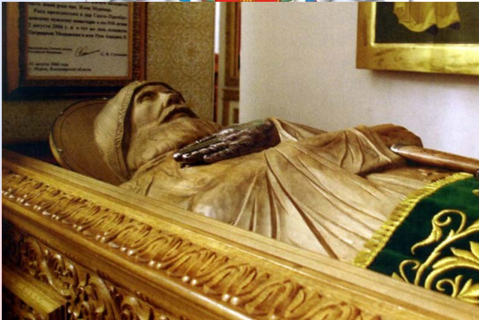
Гробница преподобного Или Муромца.