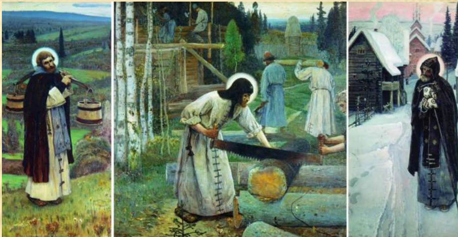
М.В. Нестеров. Труды преподобного Сергия. 1897 г.

Ответ на вопросы: «Что тебе известно о Сергии Радонежском? Где он жил и почему так много работал? Что создал? Запиши свои ответы.