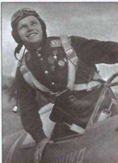
Кожедуб Иван Никитович

2. Напиши краткий рассказ о людях, представленных на фотографиях. Используй справочную литературу и Интернет