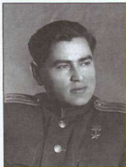
Маресьев Алексей Петрович

Кожедуб Иван Никитович – военный летчик-ас времен Великой Отечественной войны, трижды Герой Советского Союза. Во время войны ни разу не был сбит противником. Участвовал в 120 воздушных боях, одержал 64 победы в воздухе.