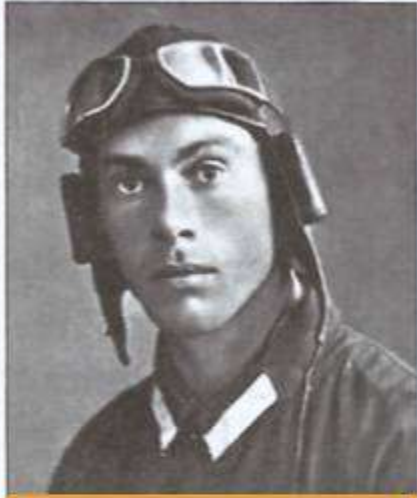
Гастелло Николай Францевич

2. Напиши краткий рассказ о людях, представленных на фотографиях. Используй справочную литературу и Интернет