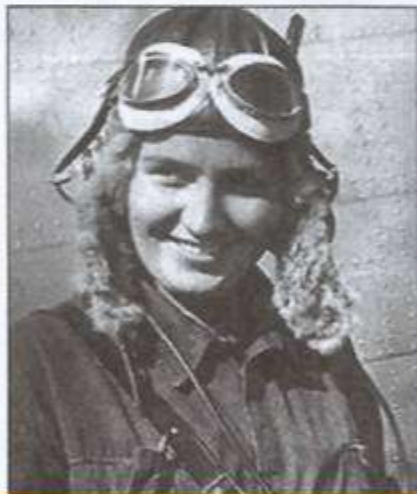
Раскова Марина Михайловна

Гастелло Николай Францевич – советский летчик, командир эскадрильи дальней бомбардировочной авиации, первым совершил таран во время боя с фашистскими самолетами. Герой Советского Союза.