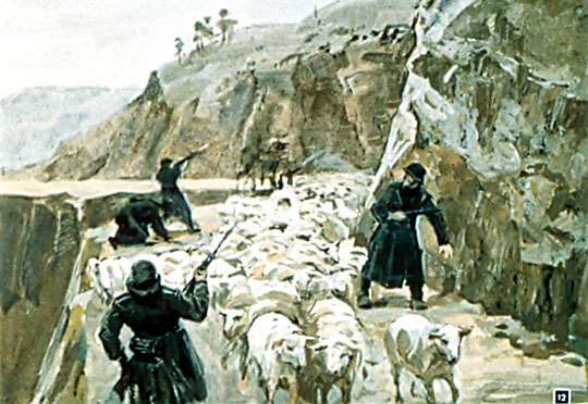
Вскоре завязался бой.